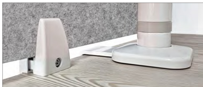
Tischklemme PW (inklusive, rechts im Bild) mit Softboard.

Exklusive Kombi-Möglichkeit mit mauser Akustik-Elementen. Dank der hoch qualitativen Gas-sprungfeder und präzisionsgefertigter Gelenkteile ist viewprime plus äußerst komfortabel in der Anwendung. Beim 2-armigen Schwenkarm ermöglichen die einzigartigen Monitor-Gleitschienen, beide Monitore intuitiv einzeln zu verschieben und präzise auszurichten. Mittels unterschiedlicher Tischklemmen ist viewprime plus speziell für den kombinierten Einsatz mit unseren Akustik-Elementen conexus.w (siehe Seite 21) und softboard (siehe Seite 30) geeignet.