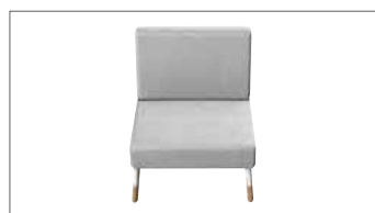
Sessel ohne Armlehne.