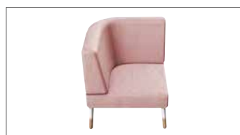
Sessel mit Armlehne, rechte oder linke Ausführung.