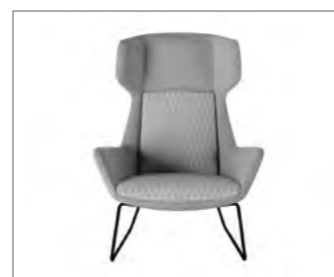
Kufen-Gestell aus Metall.