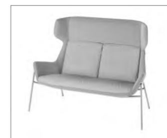
4-Fuß-Gestell aus Metall.