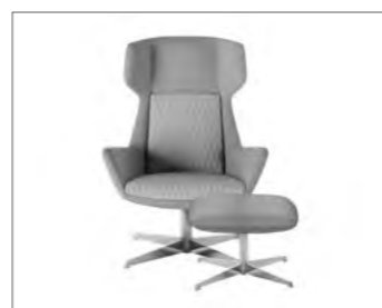
Verchromtes Fußkreuz auf Gleitern.