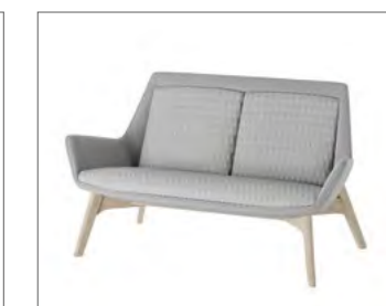
4-Fuß-Gestell aus Holz.