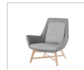
4-Fuß-Gestell aus Holz.