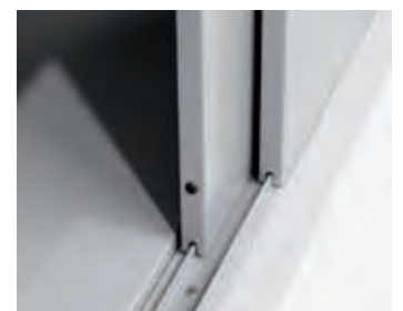
Leichtgängige Schiebetüren auf Kugellagerrollen in spezieller Schienenführung.