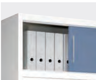
Schiebetüren-Aufsatzschrank mover nimmt zusätzliche Ordner auf.