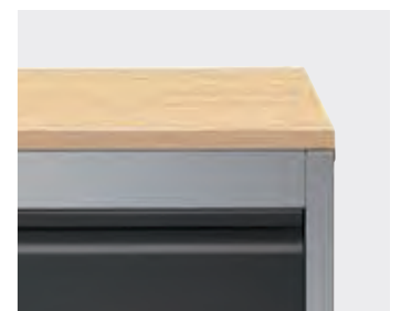
Abdeckplatte melaminharzbeschichtet (25 mm) mit ABS-Umleimer.

Wenn Stapelung gewünscht, dies unbedingt bei der Bestellung angeben. Stapel-/Wandverbindung ist optionales Zubehör. Sie muss zeitgleich mit den Schränken in entsprechender Stückzahl bestellt werden. Nachträglich ist dies nicht mehr möglich – aufgrund der serienmäßigen Ausstattung mit Höhenausgleichsschrauben. Montage auf Anfrage.