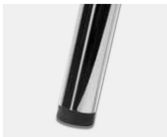
Leicht aber stabil. Stahlrohrfüße mit Fußstopfen aus Kunststoff.