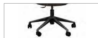
Fußkreuz, schwarz auf Rollen.