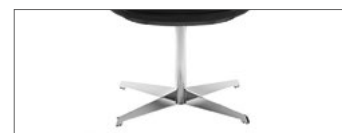
Fußkreuz verchromt, auf Gleitern.