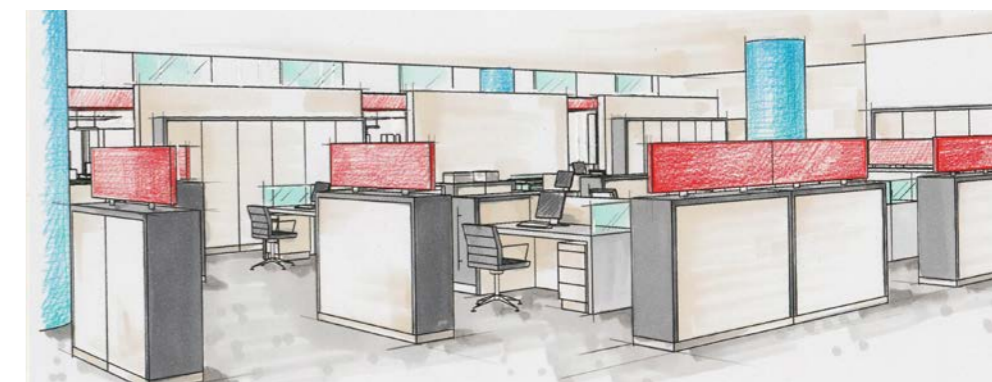
GUT GEPLANT: Kranz InnenArchitekten erstellten das Gesamtkonzept für neue Arbeits- und Kommunikationsbereiche. Die Einrichtung stammt von mauser einrichtungssysteme.

Gearbeitet wird an ergonomischen höhenverstellbaren Tischen „varitos.c“. Die Steh-Sitz-Schreibtische unterstützen die Gesunderhaltung der Mitarbeiter, indem sie einen ungezwungenen Wechsel der Arbeitspositionen erlauben. Als arbeitsplatznaher Stauraum dienen die akustisch wirksamen Hochaus-