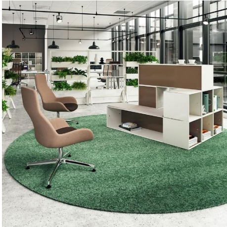
Die element.x Café-Bar by mauser