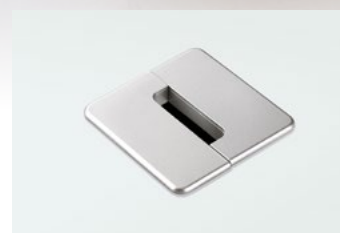
Formschöner Kabeldurchlass. Für mehr Ordnung.