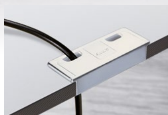
Funktions- und Kabeldurchlass.