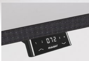
Bedienelement mit Display. Vier Memoryfunktionen für Höheneinstellung.