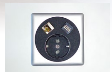
Moderne Netbox. Schnelle Verbindung für „Nomaden“.