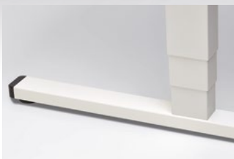
Elektromotorische Teleskophöhenverstellung. Stufenlos, für den Steh-/Sitzarbeitsplatz. Für Arbeitshöhen von 650 bis 1250 mm.