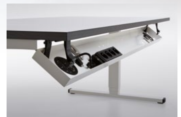
Abklappbarer Kabelkanal. Macht Kabelbündel unsichtbar.