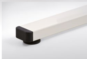
Nivelliergleiter. Für den Bodenausgleich.