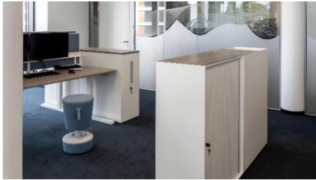
Arbeitsplatz mit zusätzlichem Stauraum xitan.s (Design Markus Bischof)