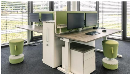
Gruppenarbeitsplatz mit Tisch-Aufsatz- blenden als Sicht- und Akustikschutz (Design Florian Seemüller)