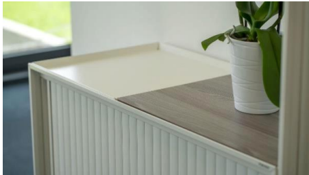
Dekor-Einlegeplatte und Tablett als Designfeature der Serie xitan.s