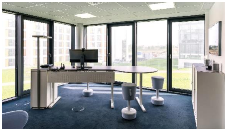
Einzelbüro mit Verkettungsarbeitsplatz