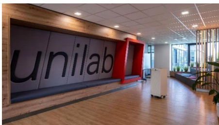
Foyer mit flexibel einsetzbarem Caddy xitan.s (Design Markus Bischof)