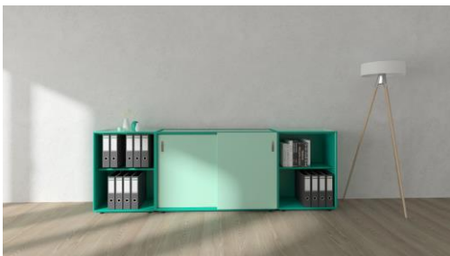
xitan.s als farbenfrohes Solitär