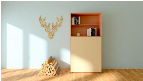
xitan.s Stauraummöbel für das Homeoffice