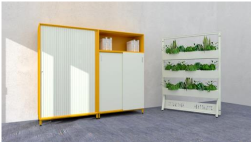
xitan.s Stauraumsystem für das Büro