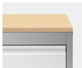
Optional Abdeckplatte melaminharzbeschichtet (25 mm).