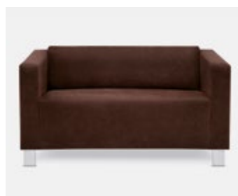
studio gibt es auch als Zwei- und Zweieinhalbsitzer.